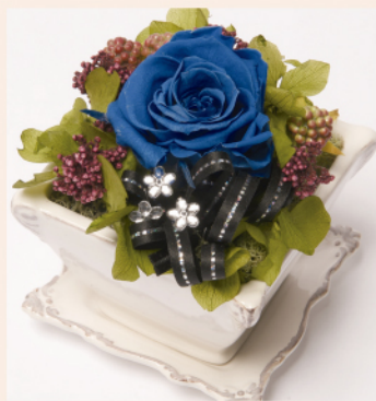
「トリアノン」商品コード M-004