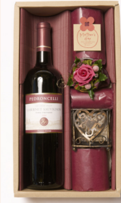
「ペドロンチェリ赤ワイン&プリザ」商品コード M-009