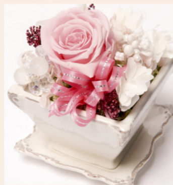
「エミーリア」商品コード M-002