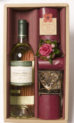
「ペドロンチェリ白ワイン&プリザ」商品コード M-008

創設80周年を迎えたカリフォルニア・ソノマ北部にある老舗ワイナリー「ペドロンチェリ」とプリザーブドフラワーのコラボレーション。