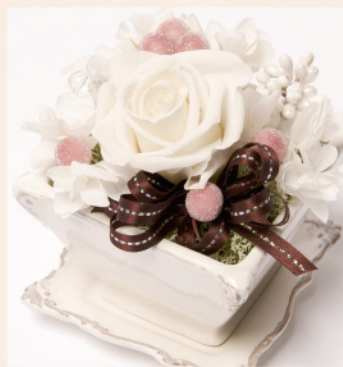
「リュクス」商品コード M-003