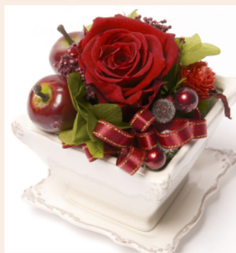
「フォンダン」商品コード M-001